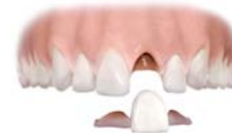
Most przymocowany do szkliwa (Maryland)