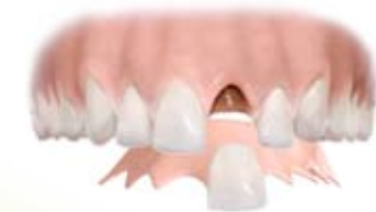
Wyjmowana proteza jednego zęba przymocowana na klamrze