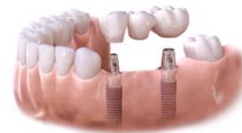
Most na implantach dentystycznych