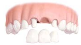
Most przymocowany do zęba