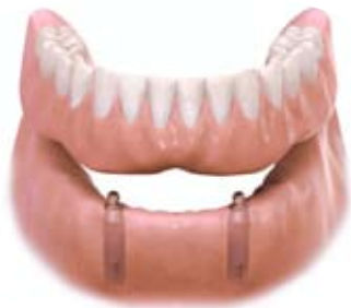
Pełen łuk na implantach dentystycznych – opcja wymiowana