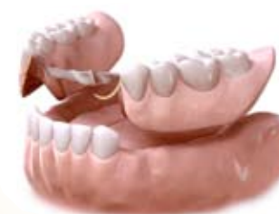
Proteza na klamrze