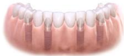
Pełen łuk na implantach dentystycznych – opcja stała