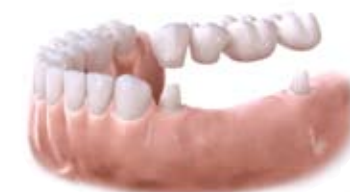
Most przymocowany do zęba